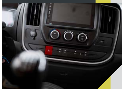
Мультимедиа система с сенсорным монитором и камерой заднего вида. Функция Bluetooth, 2 разъёма USB