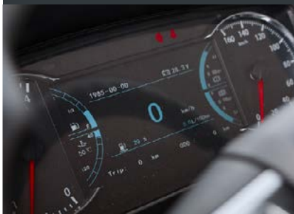
Цветной ЖК-дисплей на панели приборов