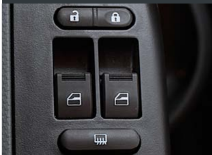
Электрические стеклоподъёмники Центральный замок с дистанционным управлением