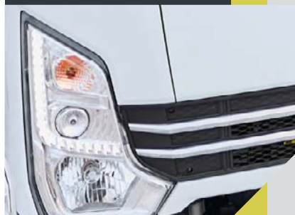
Светодиодные ленты дневных ходовых огней