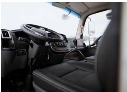
Регулировка рулевой колонки по вылету и по углу наклона