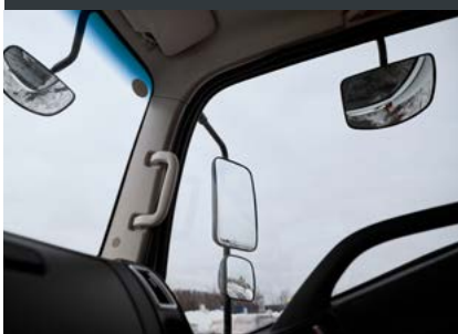
Обогрев зеркал заднего вида