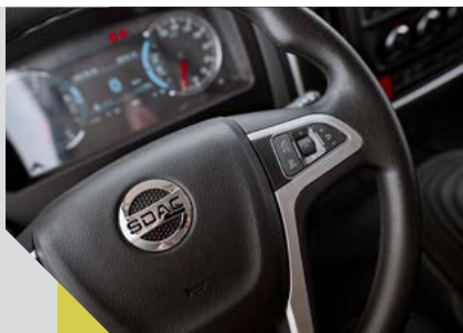
Гидроусилитель рулевого управления